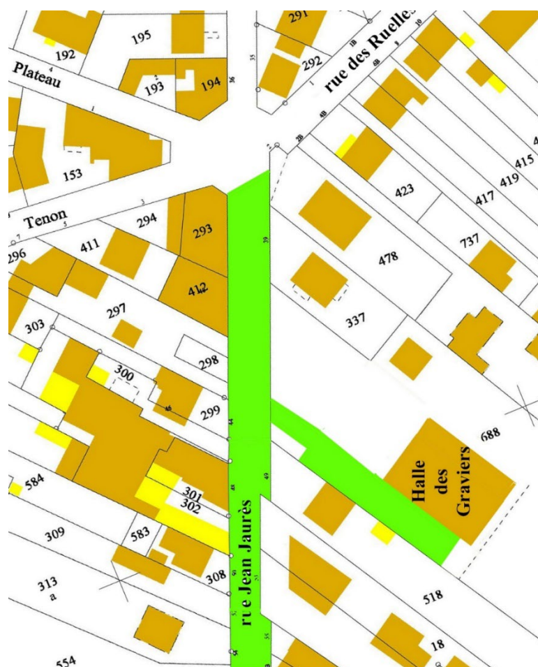
Plan 1 : plan d'occupation des exposants (en vert)